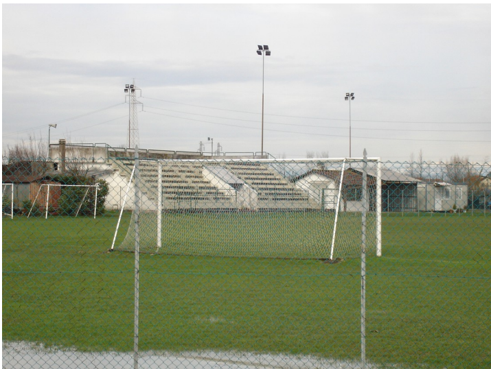
1) IMPIANTI SPORTIVI